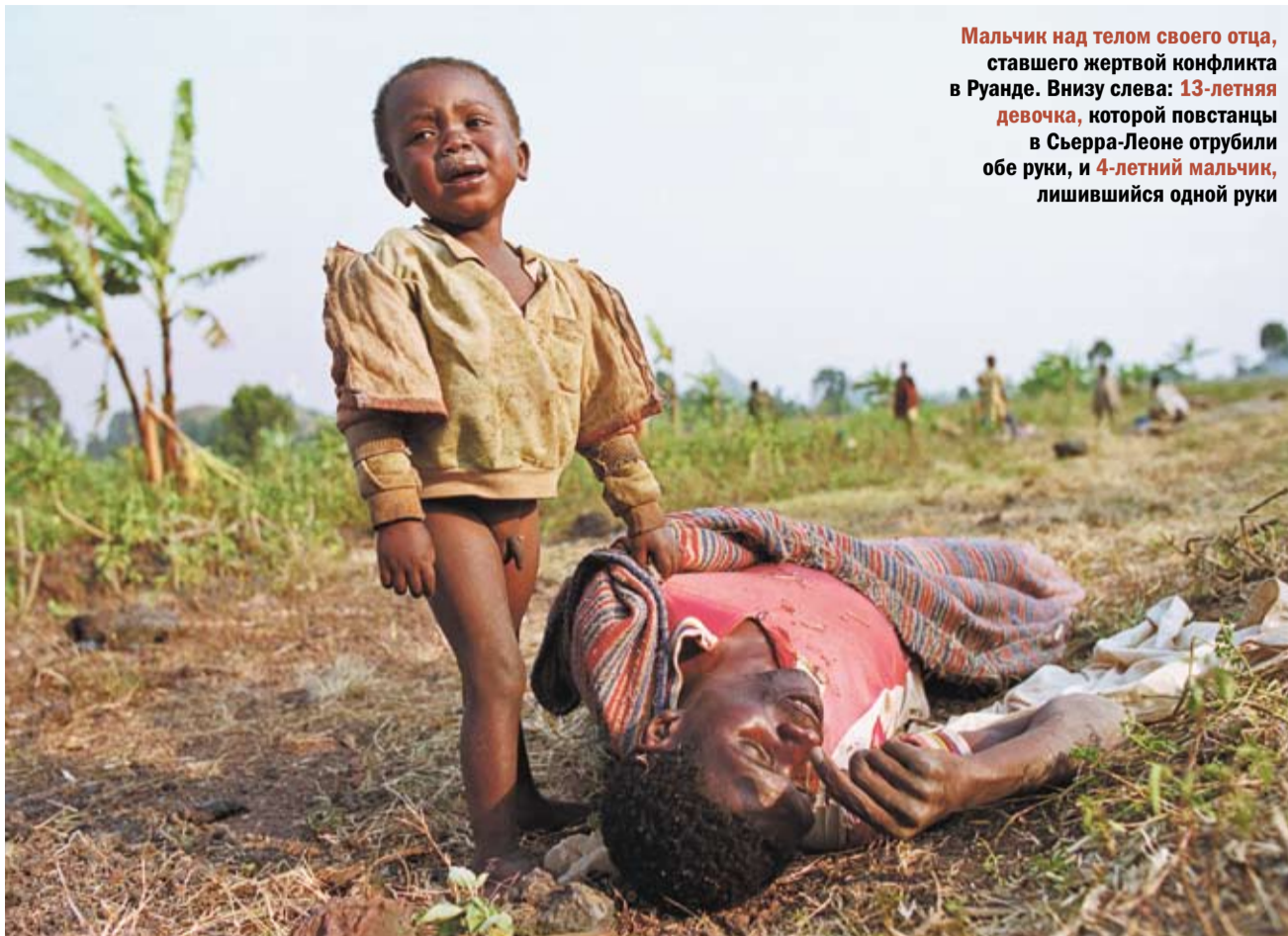
Мальчик над телом своего отца, ставшего жертвой конфликта в Руанде. Внизу слева: 13-летняя девочка, которой повстанцы в Сьерра-Леоне отрубили обе руки, и 4-летний мальчик, лишившийся одной руки