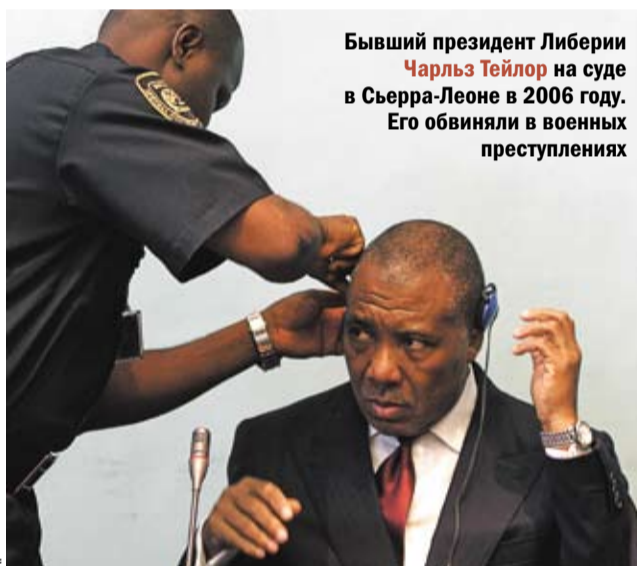
Бывший президент Либерии Чарльз Тейлор на суде в Сьерра-Леоне в 2006 году. Его обвиняли в военных преступлениях